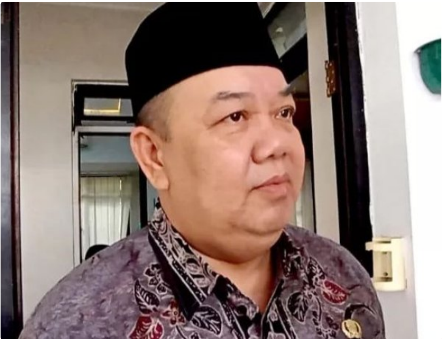
Camat Cluring Ambyah, SP

BANYUWANGI - Aksi Damai yang digelar para tokoh agama yang tergabung dalam Aliansi Umat Islam Kecamatan Cluring yang merasa resah dengan toko minuman keras (miras) yang berada di Desa Benciluk, Kecamatan Cluring,